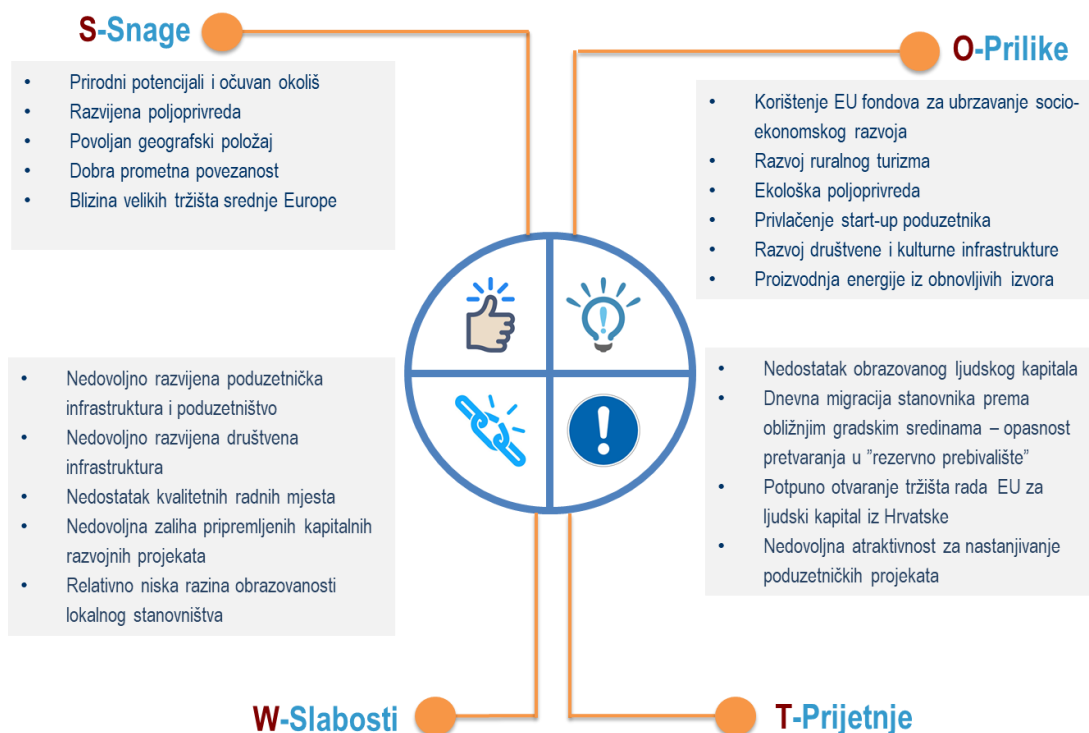
Slika 1: SWOT matrica razvojnih snaga, slabosti, prilika i prijetnji Općine Podravska Moslavina

Izvor: Plan razvoja Općine Podravska Moslavina do 2027. godine na temelju koncepta „pametna općina“